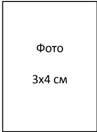
Фото 3x4 см