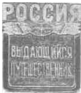
РИСУНОК НАГРУДНОГО ЗНАКА «Выдающийся путешественник России»

Знак выполнен из медно-никелевого сплава с чернением плоскостей, на которых расположены надписи. По всему периметру квадрата, кроме верхней части, идет цветная темно-зеленая полоса.