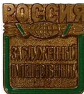
РИСУНОК НАГРУДНОГО ЗНАКА «Заслуженный путешественник России»

Знак выполнен из медно-никелевого сплава с чернением плоскостей, на которых расположены надписи. По всему периметру квадрата, кроме верхней части, идет цветная темно-зеленая полоса.