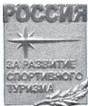
Знак II степени