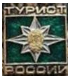
РИСУНОК НАГРУДНОГО ЗНАКА «ТУРИСТ РОССИИ»

Лицам, выполнившим установленные требования и нормы, вручаются удостоверение и знак установленного образца. Знак «ТУРИСТ РОССИИ» носится на левой стороне груди ниже государственных наград.