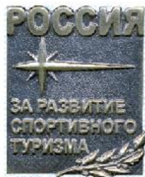
Знак III степени