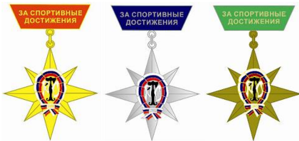
РИСУНОК НАГРУДНОГО ЗНАКА «За спортивные достижения в туризме»

При помощи ушка в верхней части и кольца знак соединен с четырехугольной колодкой трапециевидной формы высотой 10 мм. с основаниями 27 и 19 мм., залитой цветной эмалью и имеющей надпись «ЗА СПОРТИВНЫЕ ДОСТИЖЕНИЯ».