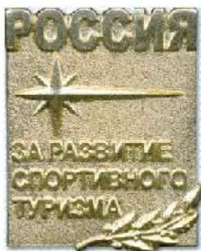
Знак I степени